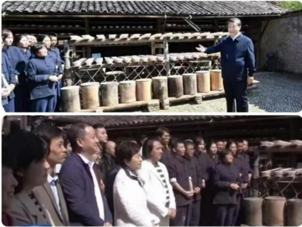
【学生受总书记接见图】