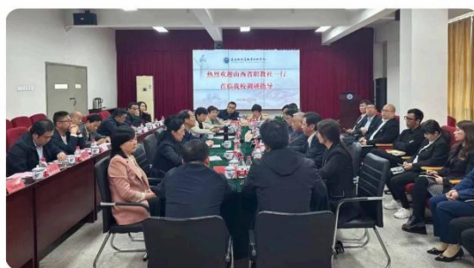
山西省职教社莅临调研指导