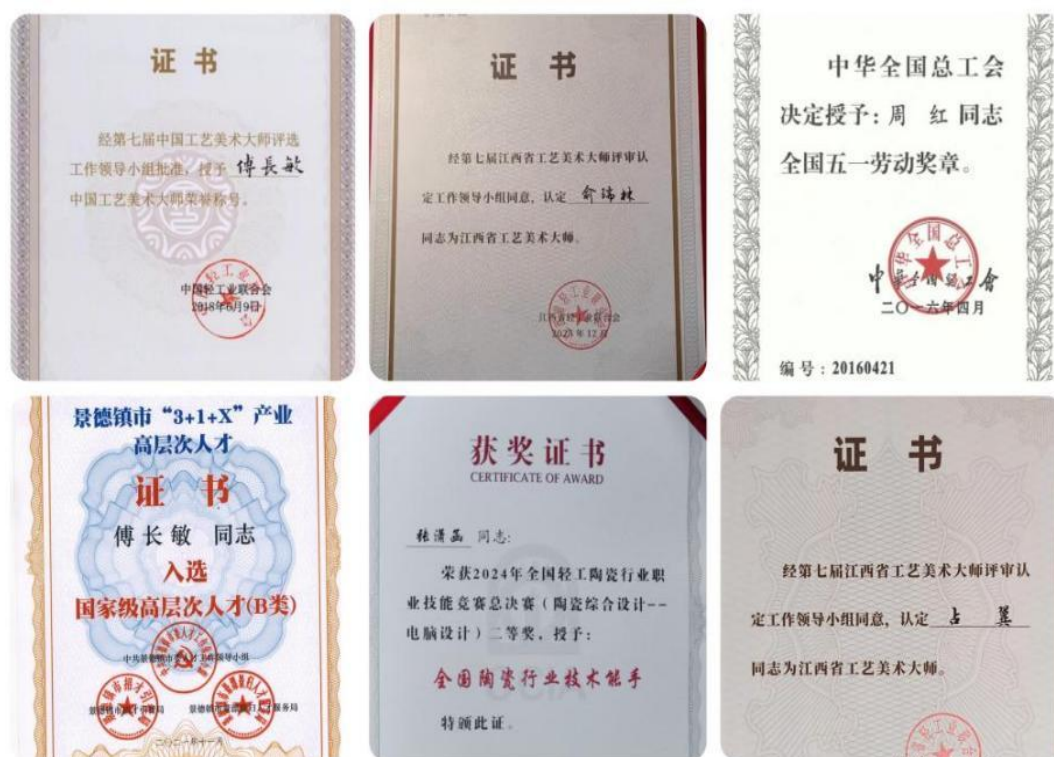
【教师部分荣誉证书图】

花传承文物修复与保护项目”、中国陶瓷工业协会“陶瓷行业职业能力评价工作先进单位”。