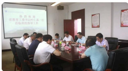
省委教育工委书记叶仁荪一行莅临调研指导

社会口碑好。 江西省省委教育工委、省教育厅、山西省政协、景德镇市委市政府等多个部门领导前来参观指导，对学校陶瓷工艺人才培养成效赞赏有加。中国陶瓷工业学会会长、中国工艺美术学会会长、景德镇陶瓷大学校长等专业人士高度评价育人成效。